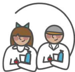
Casas de acogida