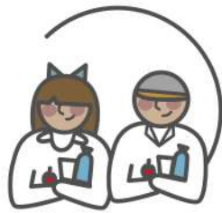
Hogares de niños