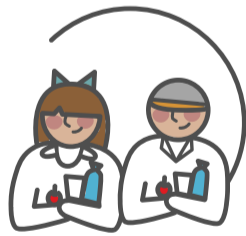
Hogares de niños