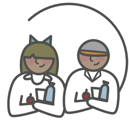
Hogares de niños