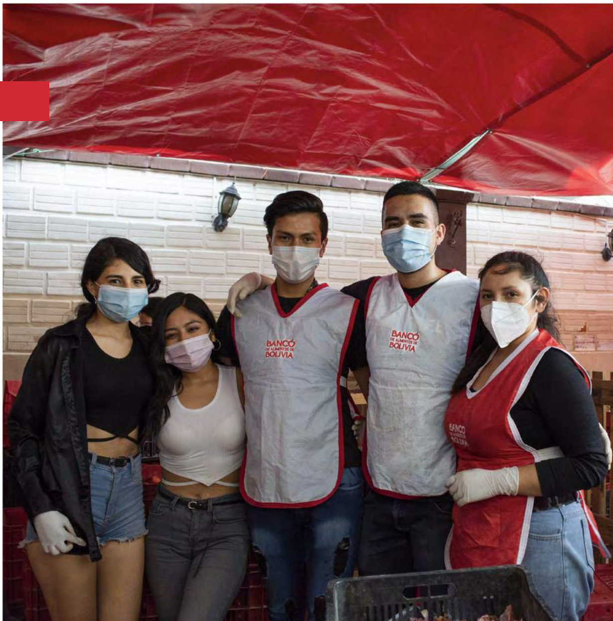
Comunicación San Simón